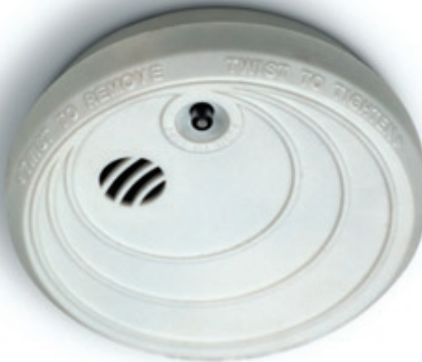
Det ska finnas minst en uppsatt och fungerande brandvarnare i varje lägenhet. Billigare liv- och egendomsförsäkring är svårt att hitta.

En brandvarnare är en billig livförsäkring som varnar snabbt och räddar liv. En tidig upptäckt ger också större möjligheter att begränsa konsekvenserna av branden. I varje bostad ska det finnas minst en fungerande brandvarnare. Finns det någon hörselskadad i bostaden måste behovet av tidig larmning vara tillgodosett även för denne. Det kan exempelvis ske genom att brandvarnaren förses med särskild ljus- eller vibrationsfunktion. En brandvarnare täcker cirka 60 kvadratmeter. Är lägenheten större än så behöver fler brandvarnare installeras. Om bostaden har flera våningsplan bör det finnas brandvarnare på varje våning. Enligt Räddningsverkets allmänna råd om brandvarnare i bostäder, är det lämpligt att ägaren till byggnaden ser till att brandvarnare installeras, men att de boende sedan själva ansvarar för att regelbundet prova att den fungerar och byta batterier vid behov.