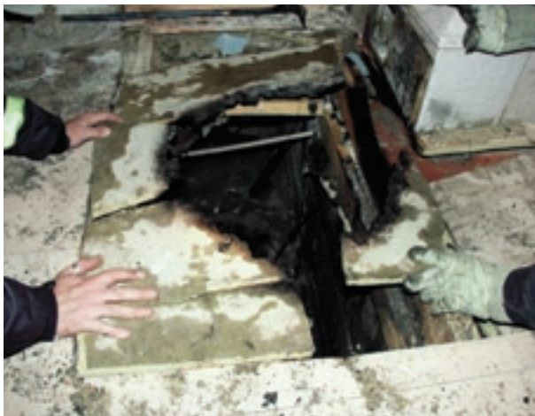
Felaktigt hanterad aska är en vanlig brandorsak. Här har golvet brunnit när aska från en kakelugn som det eldats i dagen före ställts i en plastpåse på golvet.

sotning och brandskyddskontroll ska ske för varje fastighet. Fastighetsägaren måste dock anmäla om det sker ny- eller ombyggnation av eldstäder och rökkanaler. Anmälan ska också ske om omfattningen av eldningen markant ökar eller om byte av bränsleslag sker.